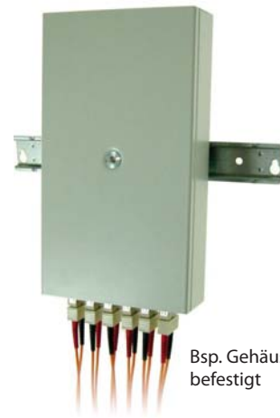
Bsp. Gehäuse an Hutschiene befestigt